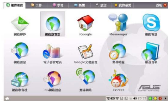
圖 2 EeePC 簡易模式的圖形使用者介面

Android Linux) 為核心技術。基本上，EeePC 並無法發生在這類地方，因為一旦限制了 Linux 自由修改的可能性，就會失去為特定使用需求發展客製化產品的可能性。換句話說，孕育出 EeePC 的台北必然存在著一個既支持 Linux 又對 Linux 版本保持開放的地方氛圍。