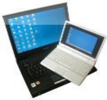
圖 1 EeePC 大約只有一般主流筆記型電腦的一半大小

啟動 EeePC 開發專案的是華碩內部扮演用戶創新者角色的一個專案小組。雖然，許多人都知道個人電腦的發展早已超出一般使用者的需求，但是，什麼樣的電腦功能對於一般使用者才「夠用」？基本上，在開發 EeePC 之前，華碩已經是一家以技術研發、產品品質受外界肯定的筆記型電腦品牌廠商（註 8），要開發出一台小筆電並沒有技術困難。問題在於，在長期跟隨跨國公司所制定之個人電腦規格的限制下，華碩就像台灣絕大部分的資訊廠商一樣完全缺乏自己制定產品規格的經驗。在華碩內部領導 EeePC 開發的是一個包括了華碩董事長施崇棠與五、六位高階主管的小組。這個小組在要求 EeePC 的效能上採用的都是來自使用者經驗的指標，例如：十秒內完成開機動作、電池續航力必須延長一倍、尺寸必須能放進女用皮包、散熱要維持跟人體體溫相同...等（陳芳毓，2008a；楊方儒，2007）；同時，他們也經常要求實際負責 EeePC 開發的團隊在設計上要從工程師的思維調整為使用者的思維（陳芳毓，2008b）。在 EeePC 開發的過程中，小組成員不僅人手一台 EeePC 隨時進行測試，同時為了避免個人使用經驗的侷限，小組成員也會以家人做「猴子測試」（monkey test）（註 9）來找出產品設計上的問題（王曉玫，2007；靖萱，2007）。由於這個領導小組始終站在使用者的立足點上看問題，因此可以被認為啟動 EeePC 開發專案的用戶創新者。